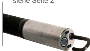
Verschiedene Werkzeuge siehe Seite 2