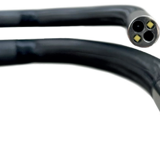
6 mm | CMOS HD Arbeits-Durchmesser